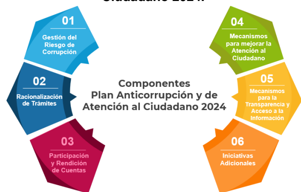
Ilustración 2. Componentes Plan Anticorrupción y Atención al Ciudadano 2024.