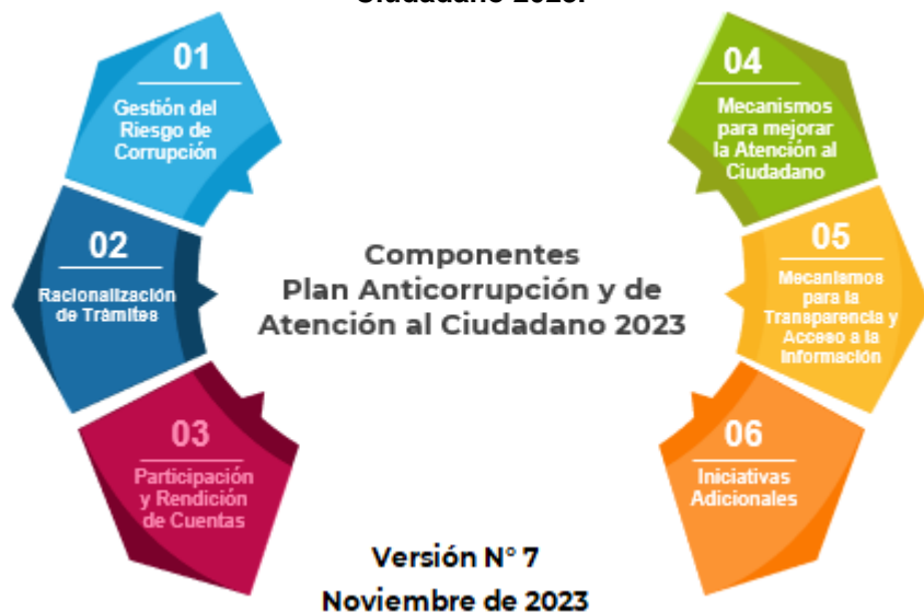
Ilustración 1. Componentes Plan Anticorrupción y Atención al Ciudadano 2023.